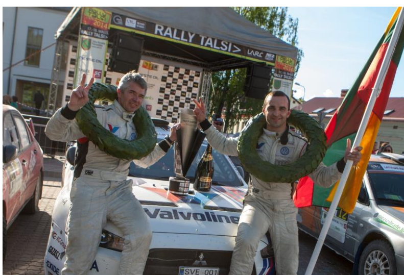
Čempionu Kausa ieguvēji 2014. gadā